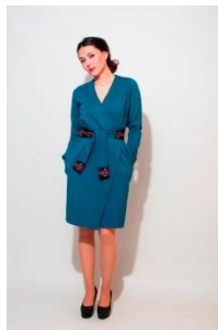
Nuuk Couture Randy kjole, 2018