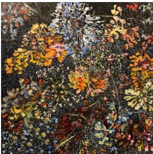
Þorunn Bara Björnsdóttir Laver på lava, 2018

søndag den 16. september kl. 10-15 i Gasmuseets sal, Gasværksvej 2, 2. sal, Hobro. Alle er velkomne, se nedenfor.