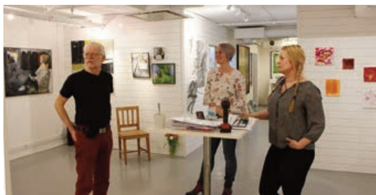
Många besökare kom till Södermalms konsthall i Skatteskrapan på Götgatan.