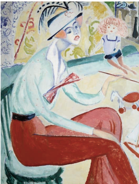
Sigríd Hjertén, självporträtt.