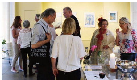
Region Öst ställde samtidigt ut på två gallerier. Bilden ovan från Gallery Magno Art på Sibyllegatan i Stockholm. Nedan från Galleri T i Gamla stan.