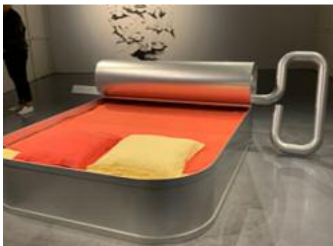
På det första museet var en stor sardinask inredd som en säng.