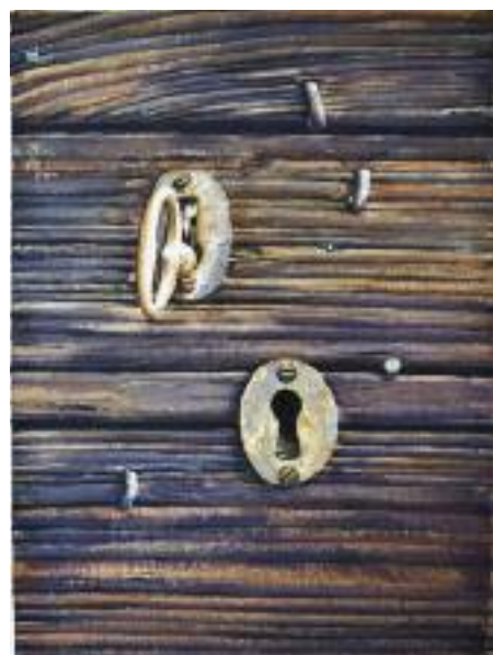
Ett favoritområde är mer dokumentärt, bilder av förfall, gamla hus och lador, framför allt närbilder av gammalt trä och rostiga föremål.