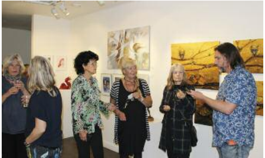
Medlemsmingel på Galleri Bellman i maj 2019.

Eftersom det fortfarande är osäkert om vi kan genomföra utställningen