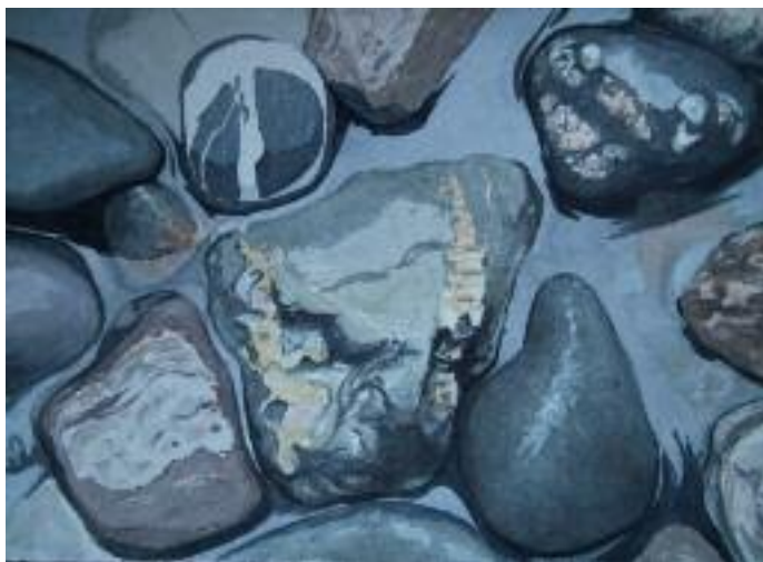
Vatten i alla de former, stilla, forsande eller fruset, gärna i kombination med stenar, som är ett annat favoritmotiv.