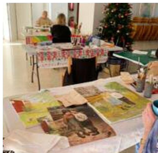
Så här satt vi och målade i svenska kyrkans lokaler.