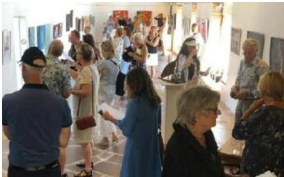
Text och bild: Meith Fagerqvist

På söndagen 16 augusti invigdes den första jurybedömda konstutställningen i Galleri Stenhallen i Borgholm. Totalt 62 konstnärer från hela Sverige hade ansökt om deltagande.