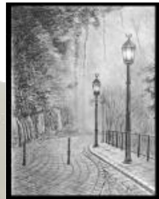
Hassan Jamshidian Mystiska dimmiga gatan.