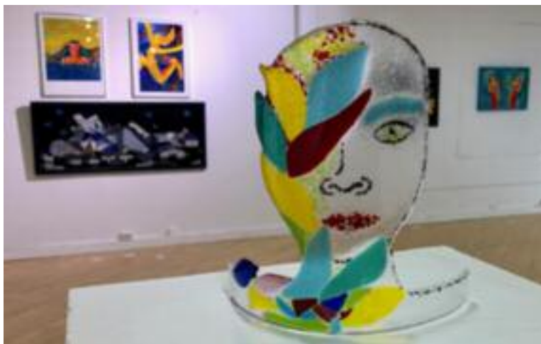
Kicka arbetar mycket med glasfusing i glada klara färger.